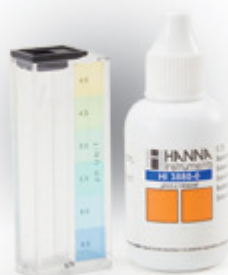
cod TINH250; TIOH252